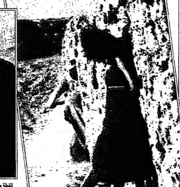
لغلة من فيلم ل جوميل